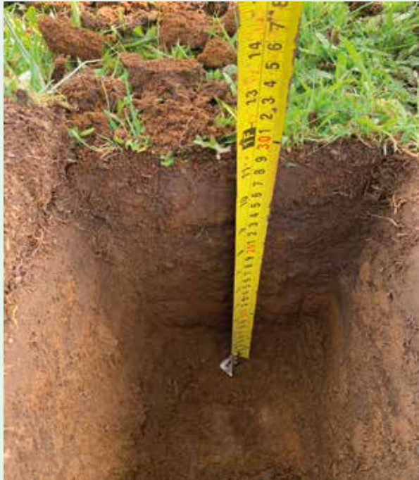
Perfil de suelo de la unidad demostrativa (andisol)

*En muchos casos, el P permanece en el suelo en horizontes superficiales, lo que implica que sus pérdidas pueden ser muy bajas, dependiendo del manejo de este y de las condiciones climáticas.